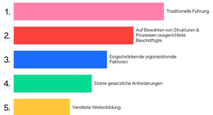
Hemmende Faktoren in der durch die Veranstaltungsteilnehmenden zugewiesenen Rangfolge

Wenn die Tatsache des lebenslangen Lernens nicht akzeptiert und gelebt wird, ist das ebenfalls hemmend. Ebenso wie veraltete Weiterbildungskonzepte, wenn Fortbildungen auf kleine Kreise begrenzt und nicht für alle zugänglich sind. Hier werden dann nur von sich aus motivierte Beschäftigte erfasst und andere Mitarbeitende nicht abgeholt.