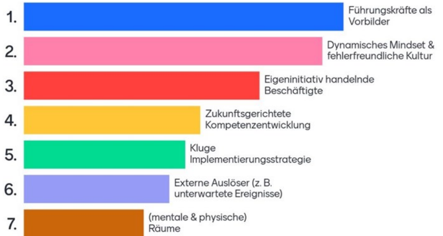
Fördernde Faktoren in der durch die Veranstaltungsteilnehmenden zugewiesenen Rangfolge

Ein statisches Mindset, das auf Bewahren ausgerichtet ist, ist wenig hilfreich, ebenso Ängste sowie Überforderung im Anblick der Agilität.